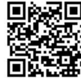
오디오 진로정보 진로레시피