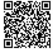
동영상 진로탐사대 드림주니어